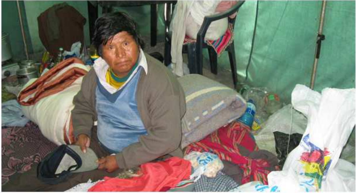
Ett av offren för översvämningarna som mist sin bostad och sina tillhörigheter.

I en liten stad en mil utanför Cochabamba hade ett läger satts upp för de familjer som mist sina bostäder. Flickorna på barnhemmet bestämde sig för att hjälpa översvämningsoffren och samlade i februari ihop kläder de vuxit ur samt en del leksaker de ville skänka till de barn som mist sina hem. Tillsammans med flickornas donation och en mängd andra donationer som kom in till barnhemmet inför resan till lägret, packades barnhemsbussen full med kläder, filter, mediciner osv. och några av flickorna fick följa med för att genomföra donationen. I maj gjorde de ännu en resa ut till lägret med en större donation än den första.